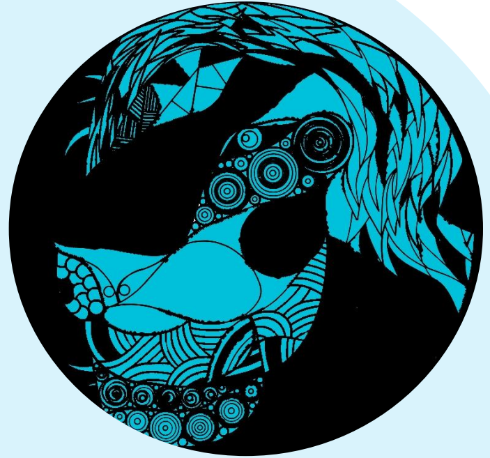
リアルにしました。