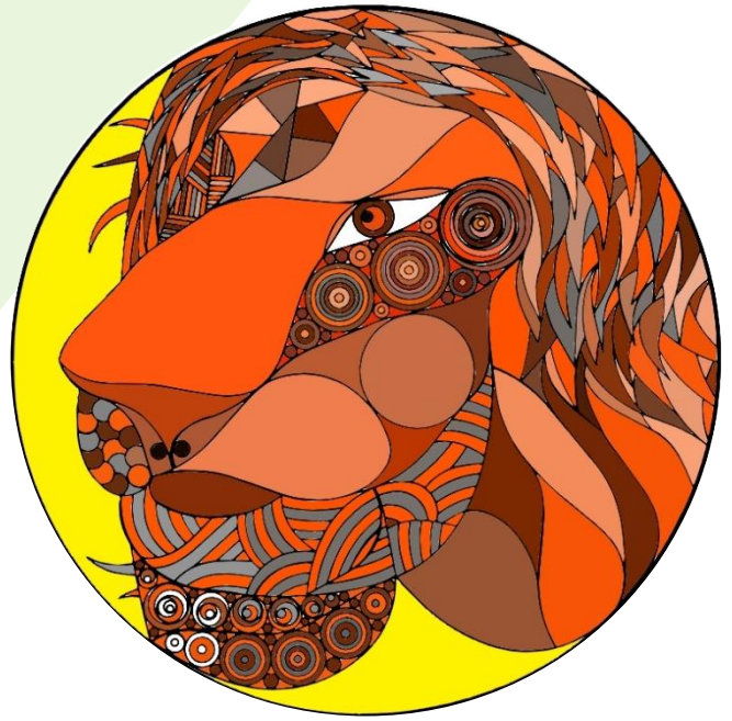
茶色をメインに工夫しました。