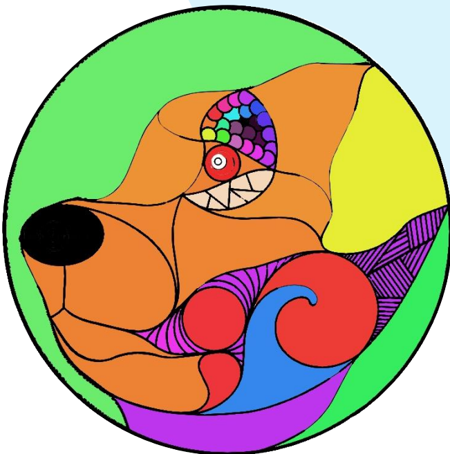
カラフルに仕上げました。