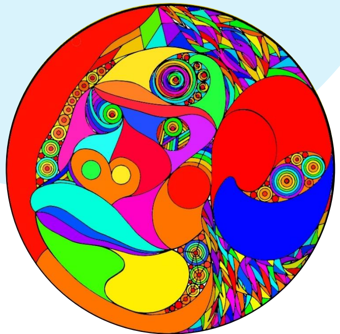
美しく仕上げました。