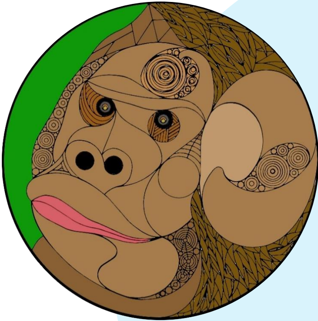
いろんな茶色を使って、塗る場所を工夫しました。