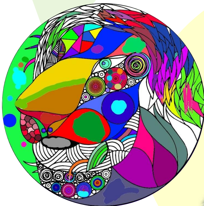
カラフルにしました。

■ワークショップ後に花小金井南中学校の先生方から感想のコメントをいただきました。