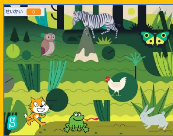
「動物昆虫クイズゲーム」の画面

Scratch*を使い、「動物昆虫クイズゲーム」を作ります。たまごで生まれてくる動物や昆虫を探し出すゲームです。作り方を覚え、ワークショップ後は子ども達が自分の知っていることをクイズゲームにアレンジし、子ども達同士でゲームを通して知識をシェアすることを目指しています。